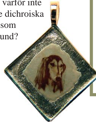
Foto i Glas

Färg, form eller varför inte det glittrande dichroiska glaset som bakgrund?